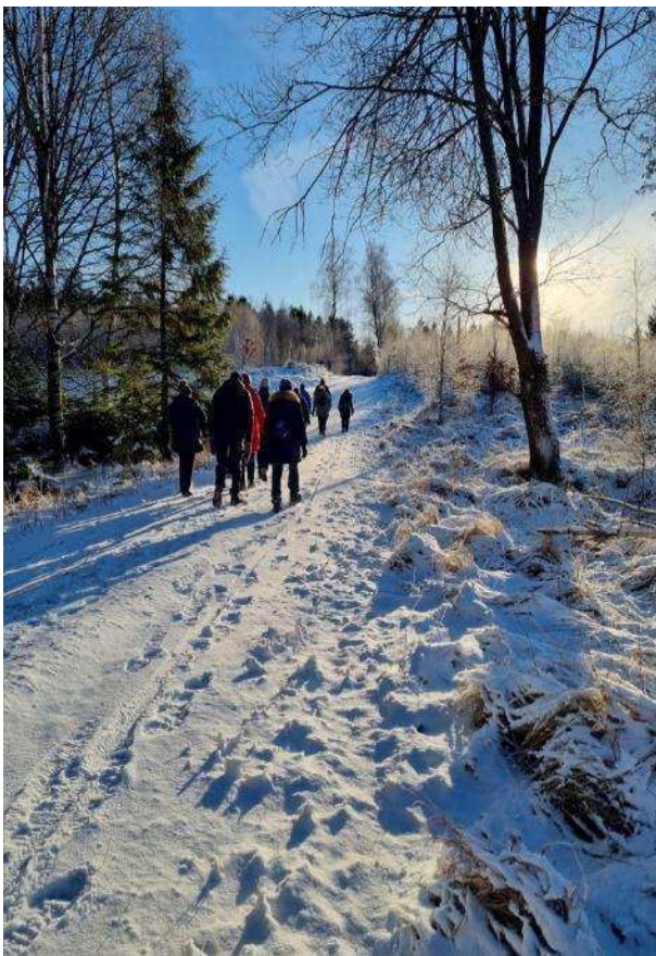
Gribskov – Vinterbillede

Facebook (søg på): GHK Gribskovens Hårde Kerne