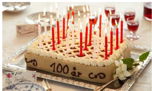
100 År blev vi ikke – men vi er godt på vej - og der var lagkage alligevel !