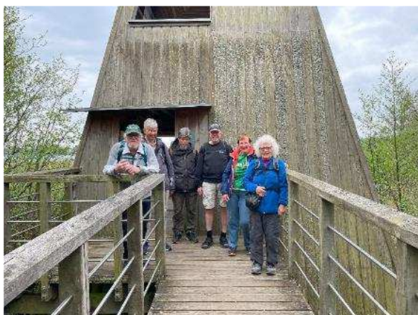
Frokost i det grønne.

Søndag den 5. maj gik Søndagsturen fra Birkerød S-station til Værløse S-station. En dejlig tur gennem skov, marker og naturstier.