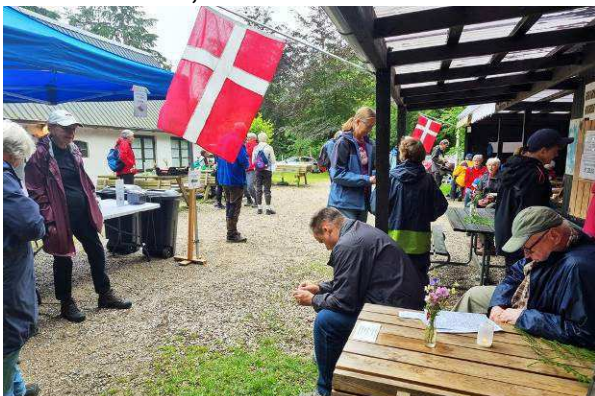
51-års Fødselsdag afholdt 6. juli

Efter vandringen var der traditionen tro Grill-Pølser, drikke mv.