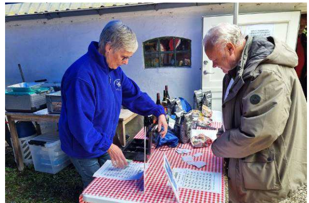
Nogle havde heldet med sig i lotteriboden, hvor der kunne vindes flotte gevinster.