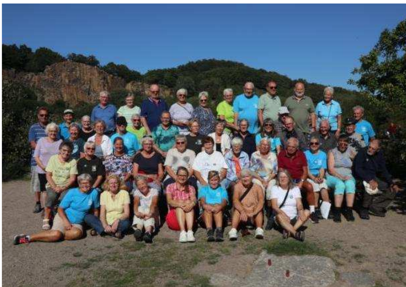
Feriebillede fra Bornholm 2023

Den 24. august tager 50 krudtugler af sted på denne for- håbentligt dejlige tur. Læs mere i næste blad.